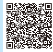
見学受付フォーム

まずはお気軽にご見学、体験に来てみませんか？ お電話で直接プロデュース道までお問い合わせください。 ※利用に際して、障害手帳の有無は問いません